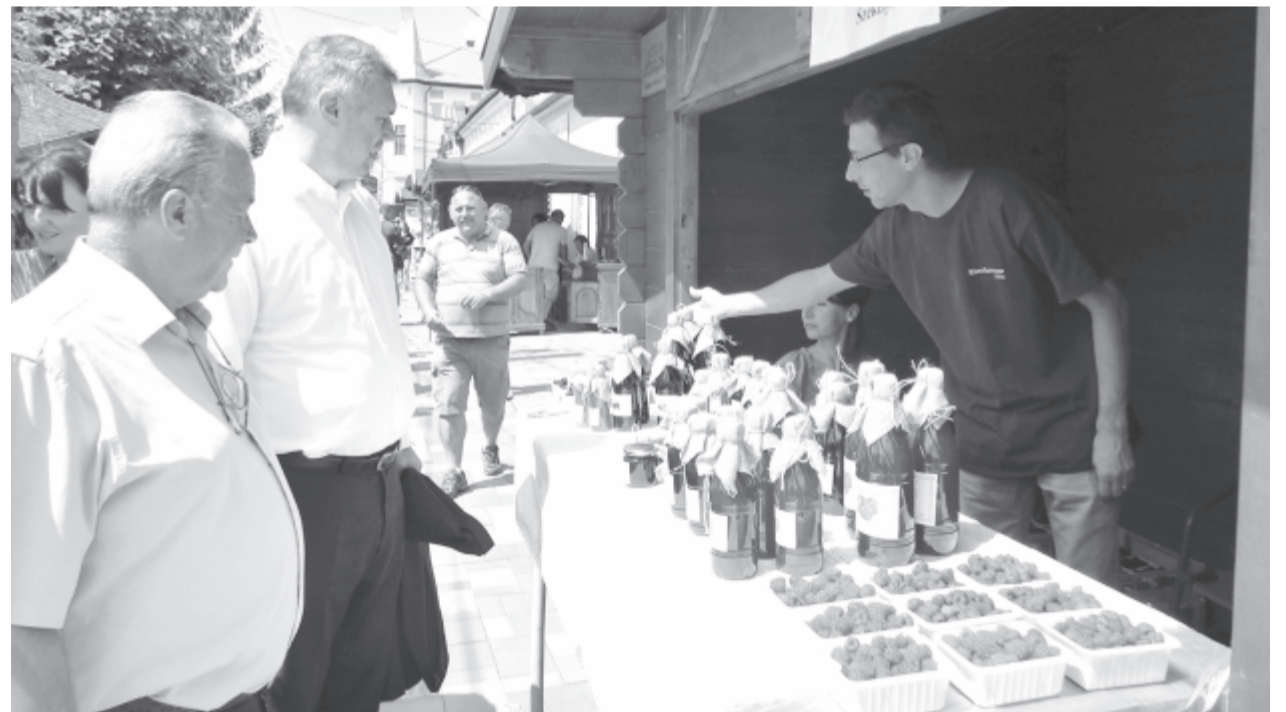
Elmaradhatatlan esemény a helyi és kézműves termékek vására

A rendezvény szervezői Nyárádszereda önkormányzata, a Nyárádmunte Kistérségi Társulás, a Nyárádszeredai Ifjúsági Szervezet, a fesztivál főtámogatója a Maros Megyei Tanács. A rendezvény részletes programja az önkormányzat és a kistérségi társulás Facebook-oldalán is elérhető.